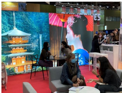
IFTM Top Resa 2021 会場の様子