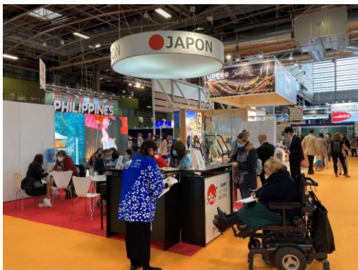
IFTM Top Resa 2021 会場の様子

つきましては、以下のとおり出展参加者を募集いたしますので、下記概要・出展要項をご覧ください、ぜひ積極的なご参加をご検討くださいますようお願い申し上げます。