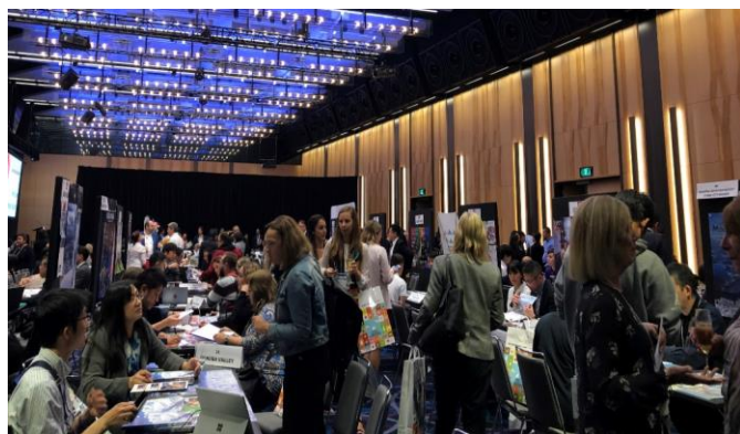
Japan Roadshow2019 シドニー会場の様子

JNTO シドニー事務所では、ビジット・ジャパン (VJ) 事業の一環として、豪州の現地旅行会社等を対象とした訪日旅行商談会「Japan Roadshow 2022」を開催します。つきましては 参加を希望される団体数の事前把握 のため、現状での参加のご意向についてお伺いし、以下のとおりご案内します。 なお、正式な参加申込の開始は、7月末頃を予定しており、ニュースフラッシュを通じて改めてご案内いたします。