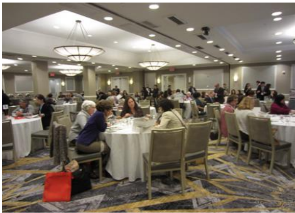
2019年度の高談会の様子

JNTO ニューヨーク事務所とロサンゼルス事務所は、訪日旅行商品を取り扱う旅行会社（以下：リテール・エージェント）を対象に販売力・手配力の向上を目的として実施する訪日旅行セミナー「ジャパン・ショーケース (Japan Showcase)」を開催いたします。つきましては以下の通り、サプライヤー参加者を募集いたしますので、ぜひ参加をご検討賜りますようお願い申し上げます。なお、参加枠には限りがございますため、ご希望に添えない場合もございます。予めご了承ください。