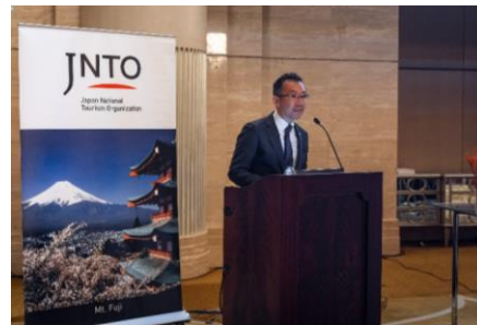
旅行会社向け訪日プロモーションセミナーの様子