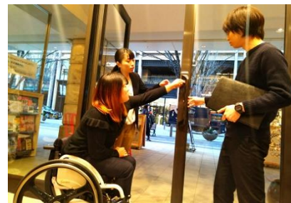
「インクル MARUNOUCHI」スタッフによる点字の確認