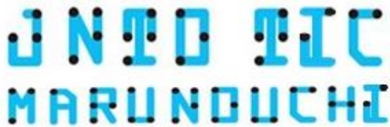
目でも指でも読める新たなスタイルの点字「ブレイルノイエ」

今後も丸の内エリアを拠点としたインバウンド専門施設として、先進的な観光案内サービスの導入に取り組み、日本全国の観光案内所からの視察を受け入れるなど、ユニバーサルデザイン対応の知見共有にも努めてまいります。