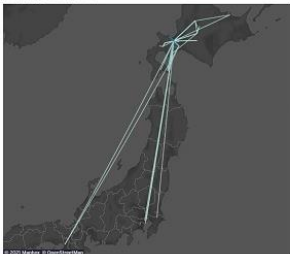
24時間以内の周辺ルート