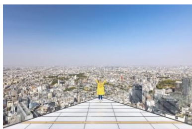
展望施設「SHIBUYA SKY(渋谷スカイ)」

「2019年の米国からの訪日旅行者数は前年比12.9%増の172.4万人と過去最高を記録しました。新型コロナウイルス感染症の影響で旅行自粛を余儀なくされた米国旅行業界においては国内需要が戻りつつあり、訪日機会を待ち望む声も増えています。また、東京オリンピック・パラリンピック競技大会の会期中には多くのメディアで日本が取り上げられるなど、米国における日本の注目度はますます高まっています。JNTOではこうした好機を生かしながら、往来再開に向けて引き続き訪日観光の魅力を発信・提供に積極的に取り組んでいきます。」