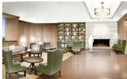
宿泊者専用ラウンジ