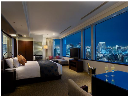
ホテル ザ セレスティン東京芝 エグゼクティブコーナーツイン