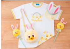
Tシャツ S~LL 各 2,600 円 3L 2,900 円 ポシェット 2,500 円 サンバイザー 2,600 円 手持ちバルーン 600 円