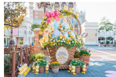
アメリカンウォーターフロントのデコレーション

ミラコスタ通りには、“うさピヨ”誕生のストーリーが描かれたデコレーションが設置されます。また、メディテレーニアンハーバーには、イースターエッグに乗った“うさピヨ”のフォトポイントが登場します。加えて、アメリカンウォーターフロントのウォーターフロントパークには、ミッキーマウスやプルートの真似をしたり、ミニーマウスやデイジーダックと人なつっこく触れ合う“うさピヨ”をデザインしたかわいらしいデコレーションのほか、“うさピヨ”に乗って楽しめる体験型のデコレーションも登場します。