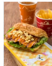
「ドックサイドダイナー」 スペシャルメニュー

「クッキー・アンのグリーティングドライブ」で盛り上がるアメリカンウォーターフロントのレストラン「ドックサイドダイナー」には、好奇心旺盛でいろいろなものをミックスしたり、楽しい食べものを作ったりすることが得意なクッキー・アンらしいメニューが登場します。デニッシュにローストビーフとチーズ&ペッパー味のクランブル、ロメインレタスなどが組み合わせられ、まるでシーザーサラダそのものがサンドされたかのような味わいと食感が楽しめるメニューです。