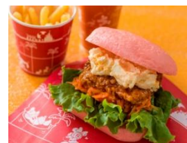
ニューヨーク・デリ スペシャルセット 1,260 円

※プラス 200 円でソフトドリンクをスペシャルドリンクに変更することができます