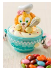
「ドックサイドダイナー」 カラフルチョコレート、 ミニスナックケース付き

また、レストランの入口や店内には、クッキー・アンにちなんだデコレーションが施されており、この時期だけの特別な雰囲気をお楽しみいただけます。