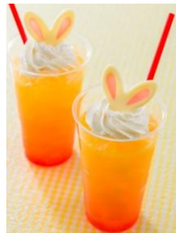
ホライズンベイ・レストラン スペシャルドリンク (オレンジ&クリーム) 450 円