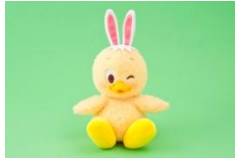
ハンドパペット 2,800 円

“うさピヨ”とディズニーの仲間たちがデザインされたグッズが約 80 種類登場します。“うさピヨ”の鳴き声がするハンドパペットや、イースターエッグの中に入った表情豊かな“うさピヨ”のぬいぐるみバッジのほか、ふわふわのポシェットやサンバイザーなどの身につけグッズ、写真映え間違えなしの“うさピヨ”型の手持ちバルーン、“うさピヨ”の顔をモチーフにしたきんちゃくに入ったクリームサンドケーキなどを販売します。