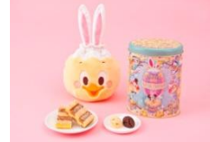
クリームサンドケーキ 1,500 円 チョコレートランチ 1,700 円