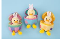
ぬいぐるみバッジ 各 1,900 円