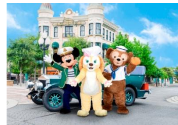
「クッキー・アンのグリーティングドライブ」

好奇心旺盛なクッキー・アンは、初めて見るアメリカンウォーターフロントの景色にわくわくしながら、ゲストの皆さまにご挨拶します。