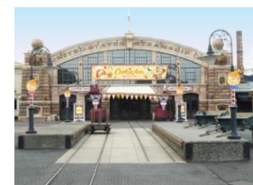
「ドックサイドダイナー」 店外デコレーション