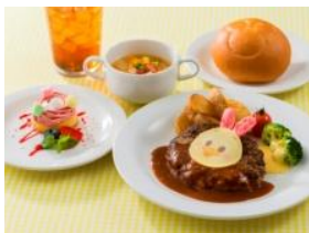
ホライズンベイ・レストラン スペシャルセット 1,980 円

「ニューヨーク・デリ」では、フライドチキンにイースターらしく卵を大きめに砕いたサラダと、テリヤキソースを春らしいピンク色のパンズではさんだサンドウィッチのスペシャルセットが登場します。