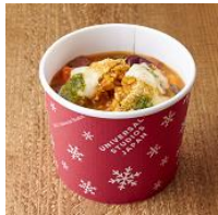
スープリゾット ～ライスロケット& ミネストローネ～