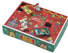
アドベントカレンダー