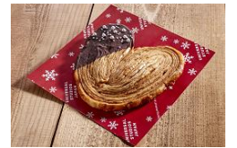
パルミエ・ショコラ ～ミルク～