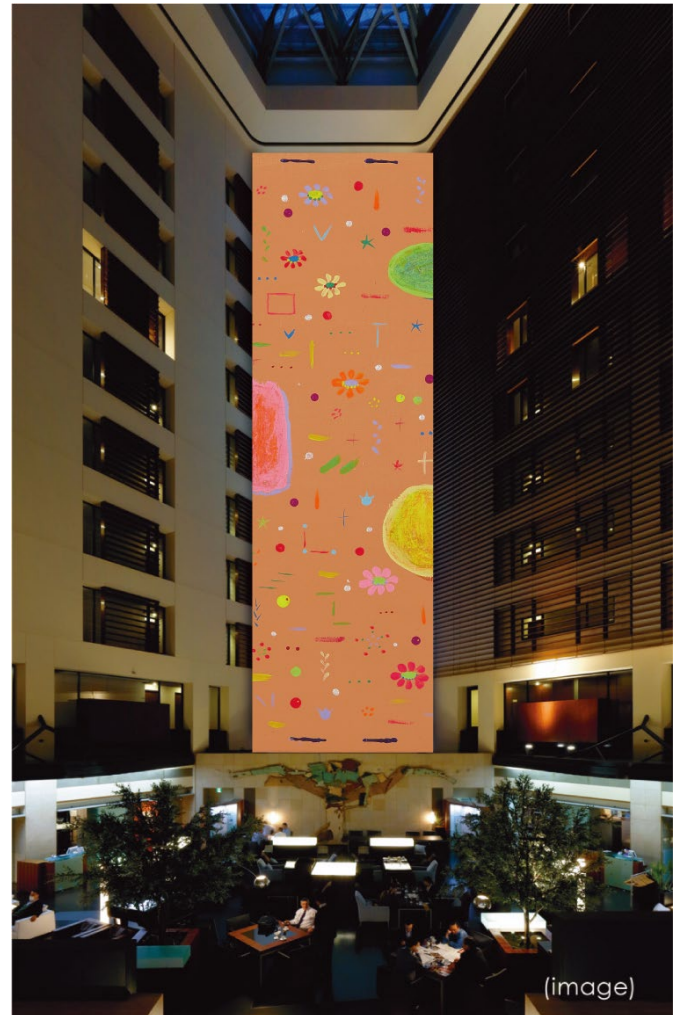
会場 / プロジェクションマッピング (イメージ)

冬は寒くて、あたたかい季節。そう語るアーティストベッキーによる「Becky -Cozy and Warm Winter!-」。寒いからこそ感じられる“あたたかさ”が散りばめられた冬。そんな季節に、ベッキーのほんわかあたたかで遊び心あふれる作品たちがパークホテル東京の展示空間を彩り、訪れるお客様をもてなします。