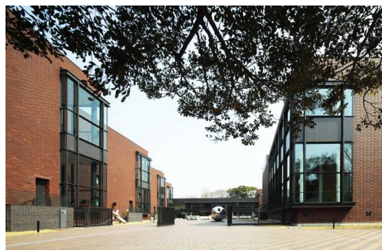
東京都美術館外観