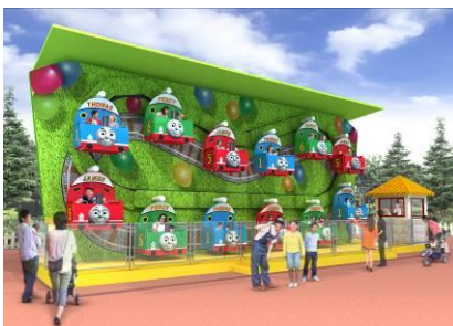
トーマスランドに新機種登場