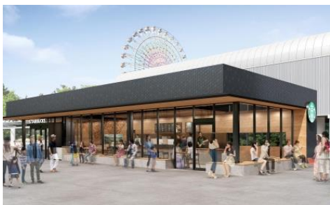
スターバックスがOPEN