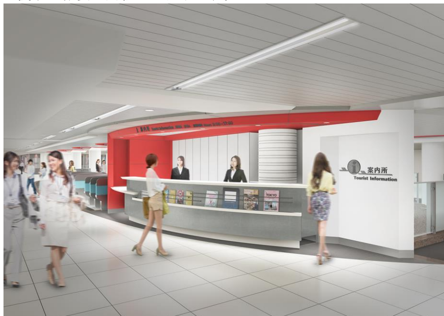
東京駅旅客案内所イメージ