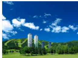
星野リゾート トマム ペア宿泊券