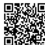
(冬の北海道観光ふりーぱす)

URL : http://www.driveplaza.com/trip/drawari/2017_hokkaido_winter