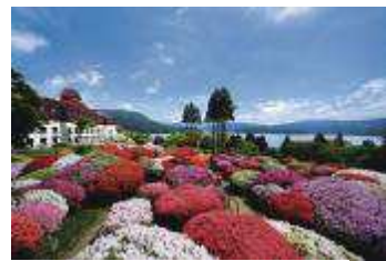
山のホテル 庭園（イメージ）