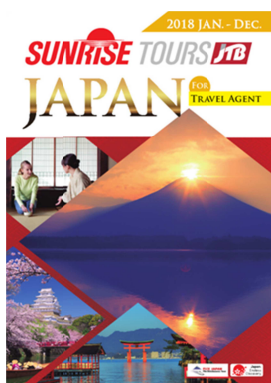
海外旅行会社向け 合冊版パンフレット 年 1 回 9 月発売