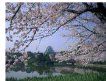
名古屋城（イメージ）