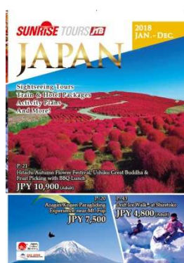
訪日外国人 (アジア) 向け パンフレット 年 1 回 9 月発売