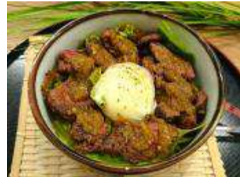
ハラール認証昼食（イメージ）