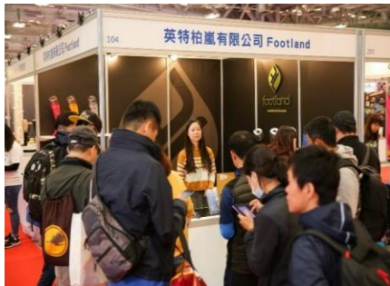
① 会場の様子（昨年度）

尚、マラソンエキスポ in 台北への出展をご希望される場合は、末尾に事務局の連絡先を記載しますので、直接のお申し込みをお願い致します。