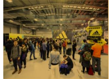
③ 会場内の様子（昨年度）