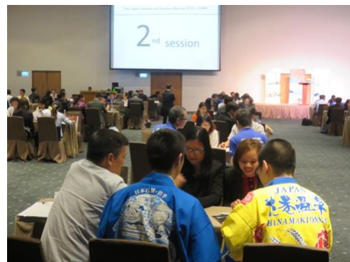
商談会の様子 ※昨年度の参考画像

事業名 : 平成 29 年度 ベトナム ビジット・ジャパン・セミナー及び商談会 (ホーチミン)