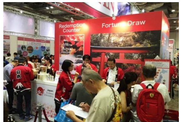
2016年8月旅行フェアでのジャパンパビリオンの様子