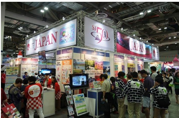
2016年8月旅行フェアでのジャパンパビリオンの様子

概要：シンガポール人訪日旅行者数は順調に増加を続け 2016 年度は 36 万人（前年比 117%）を突破しました。さらに、シンガポール人訪日旅行者の約 7 割が訪日回数 2 回目以上という、リピーター率の非常に高い市場です。平成 29 年度のビジット・ジャパン(VJ)事業の一環として、2017 年 8 月にシンガポールで開催される旅行フェア「NATAS 2017」への出展と、同旅行フェア最終日の翌日に「教育旅行セミナー・商談会」の開催を予定しています。是非、積極的にご参加をご検討ください。