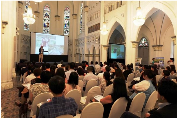
2016年8月教育旅行セミナー・商談会の様子