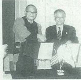
長 握手する 理事 長 JNTO 長 ハルン 長 松山 長

全で日本人が一人歩きできる国」として積極的に送客する構えで、日本旅行業協会（JATA）とマレーシア政府観光局は昨年、2014年度（平成26年度）に日本からの送客数を年間100万人とする「マレーシア100万人プロジェクト」の覚書を交わしている。